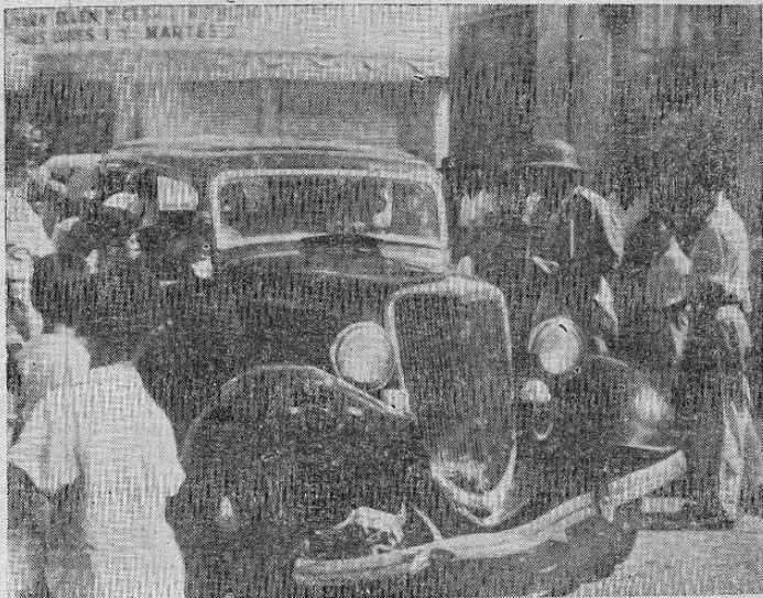
Una vista del estado en que quedó el automóvil número 3262 que chocó esta mañana con el camión nacional número 20 en la esquina del Teatro Apolo.

El Circuito de Teatros Nacionales ha invitado para esta exhibición al personal de los periódicos.