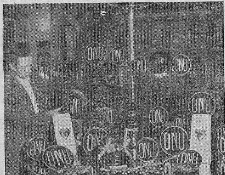
En vista de la celebración de la Asamblea General de las Naciones Unidas en París, los símbolos de la O.N.U. han aparecido por todas partes en la capital francesa. Arriba se ve la vitriera de una dulcería con cajas de dulces especialmente diseñadas para la ocasión.