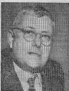
HERBERT V. EVATT

Actuando de Presidente de la Asamblea General de las Naciones Unidas, actualmente en sesión en París, el Sr. Herbert Vere Evatt es Ministro de Relaciones Exteriores de Australia y figura prominente en las sesiones de la O.N.U. desde 1945.